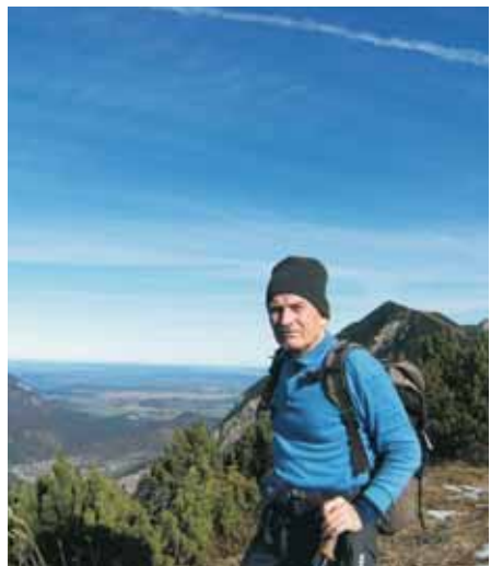
Bild: Blick von der Aussichtsterrasse

Besonders schön sind morgens die mit Eiskristallen überzuckerten Grashalme anzuschauen. Auch die Netze der Spinnenstrahlen mit Reifbesatz in der noch tief stehenden Sonne.