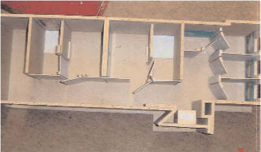
1:10. Das Holzmodell von Ernst Högl

wollen die gewöhnlich gut unterrichteten Kreise wissen, mit einer vergoldeten Schere den Strahl der Damendusche durchtrennen und dem Objekt feierlich den Namen „Bad Niederbreitenbach“ verleihen.