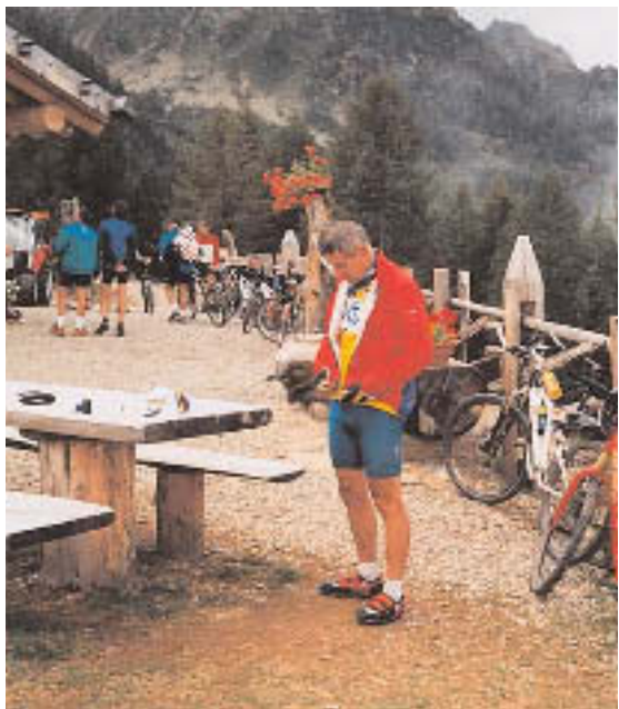
Bergeinsamkeit auf der Spitzner Alm