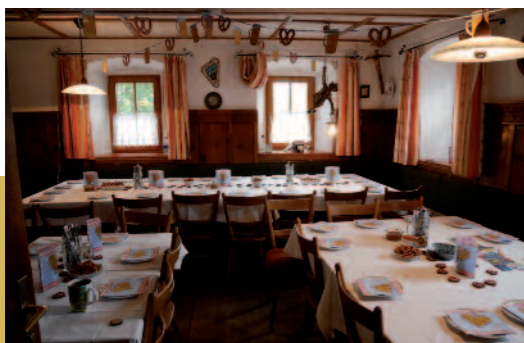
Mal einen runden Geburtstag stilvoll feiern.