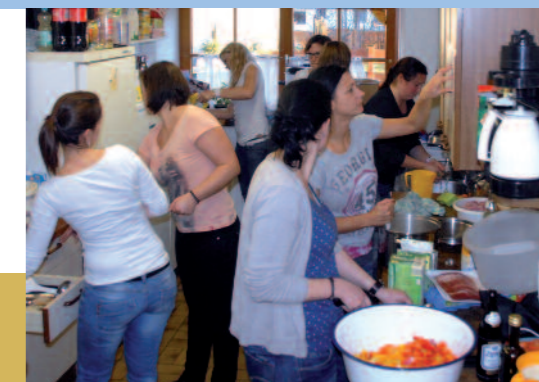
Trubel in der Küche, wo sind die Männer?