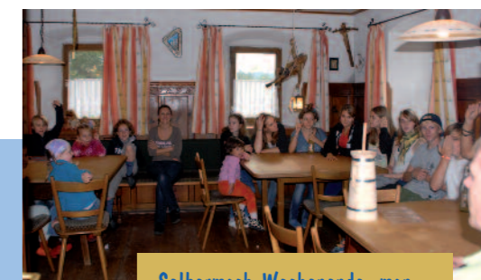
Selbermach-Wochenende, man sieht es am Butterfaß.

Die modernen Toiletten, Waschräume und Duschen lassen einen nicht ahnen, dass man in einem historischen Bauernhaus Urlaub macht.