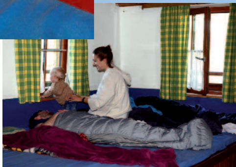
Wie heißt das noch mit dem frühen Wurm?